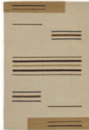
TOSCANA 201 CREME