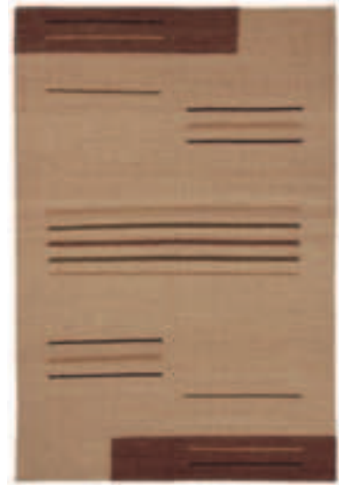
TOSCANA 201 BEIGE