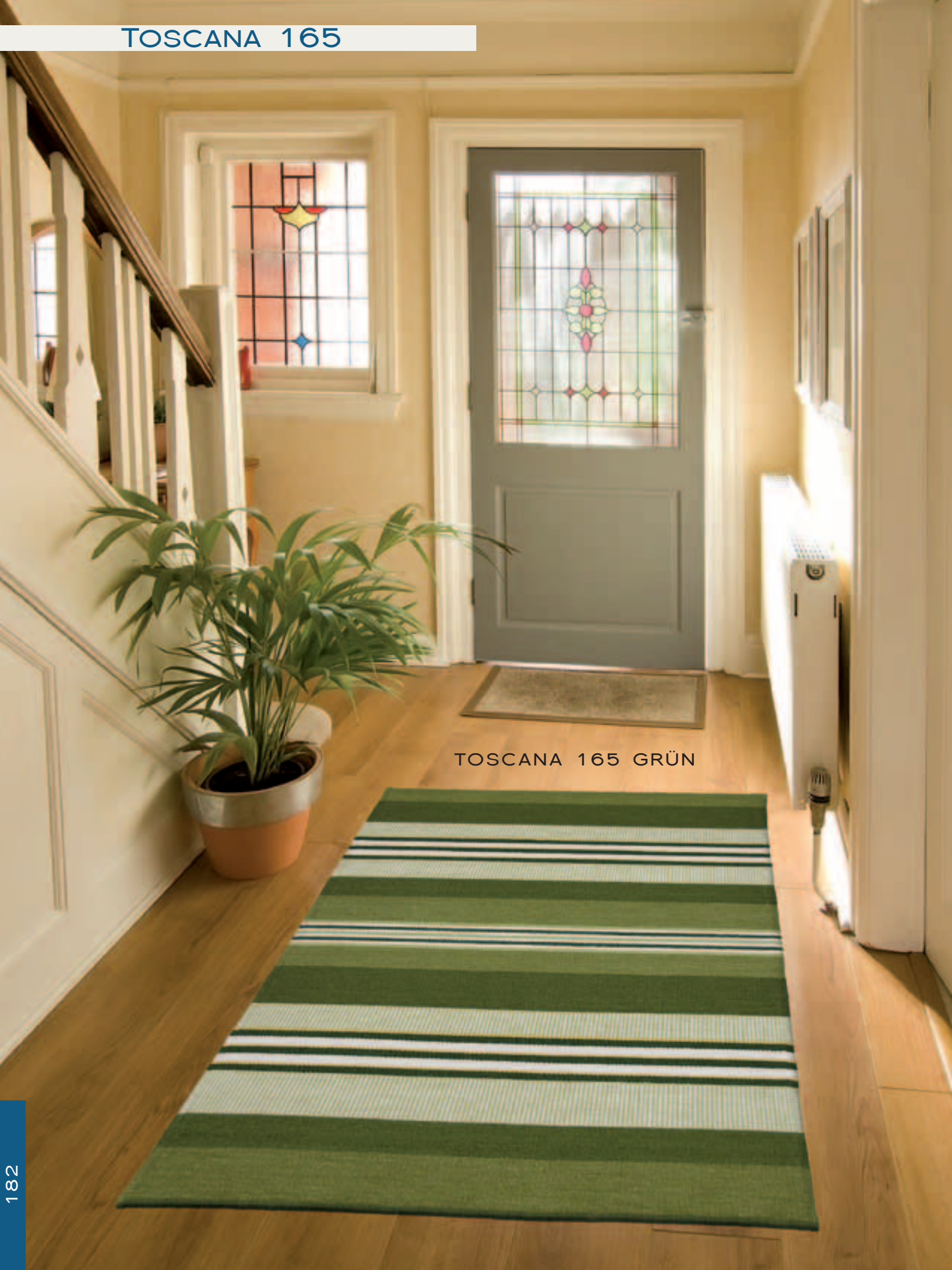
TOSCANA 165 GRÜN