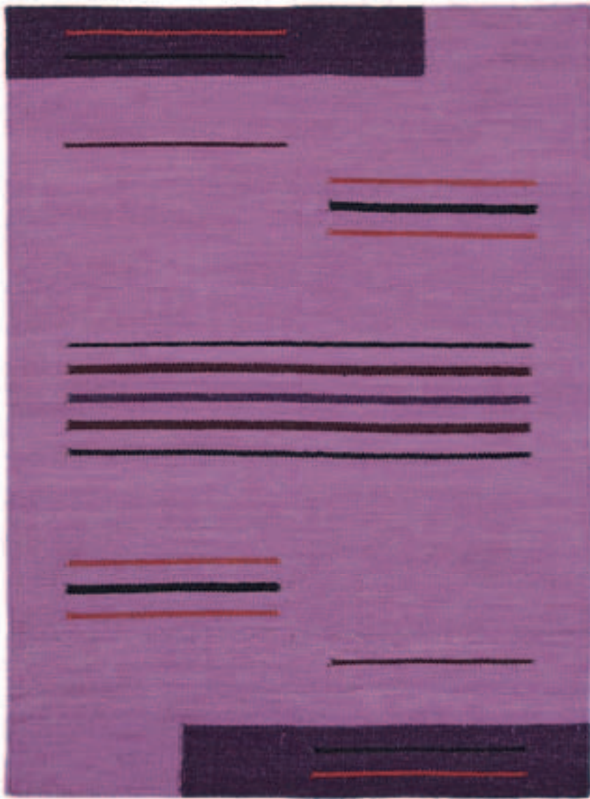
TOSCANA 201 LILA