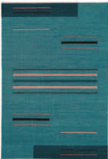
TOSCANA 201 AZUR