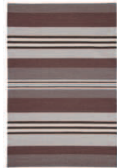
TOSCANA 165 BRAUN