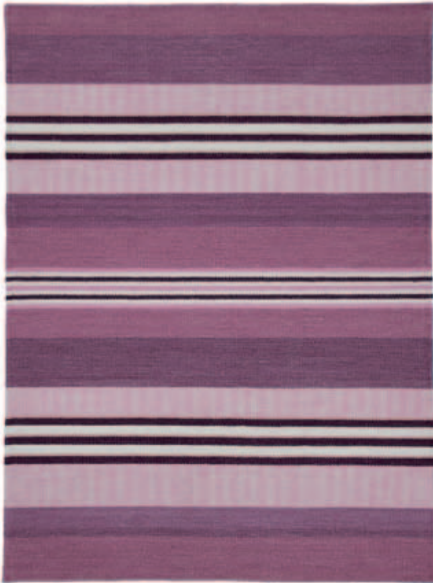
TOSCANA 165 LILA