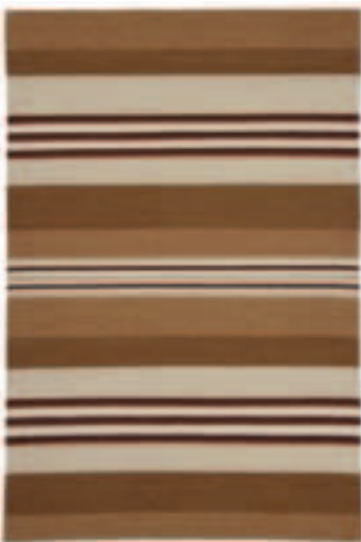
TOSCANA 165 CAMEL