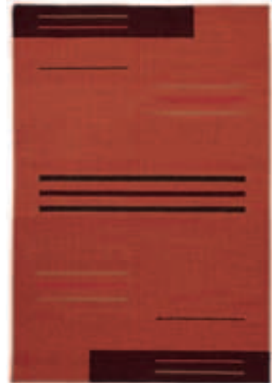
TOSCANA 201 TERRA

70/140 90/160 120/180 140/200 170/240 SONDERMASSE