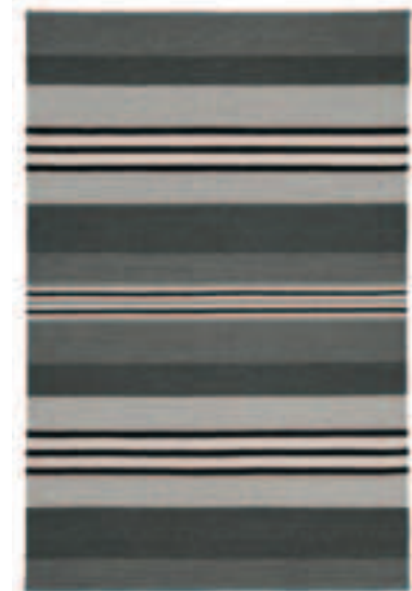
TOSCANA 165 GRAU