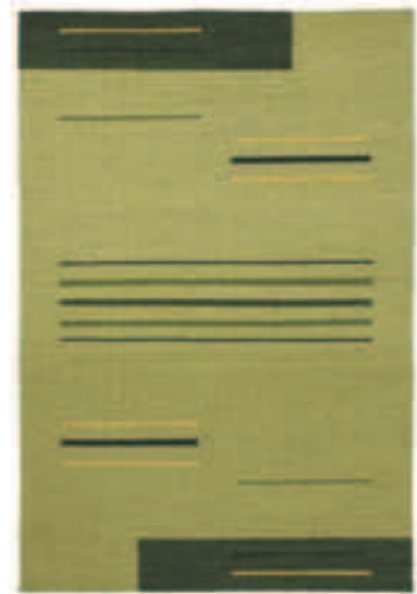
TOSCANA 201 LIMONE