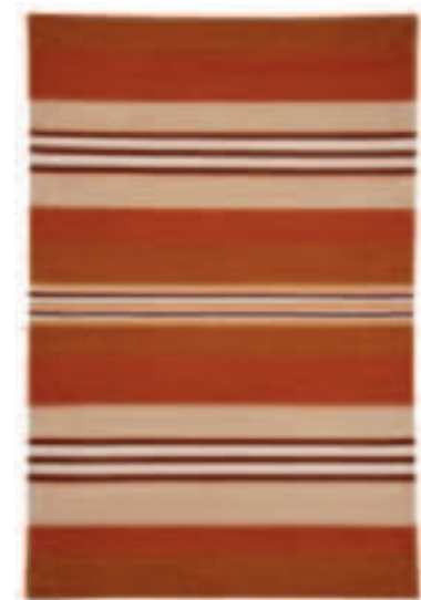
TOSCANA 165 ROT

70/140 90/160 120/180 140/200 170/240 SONDERMASSE